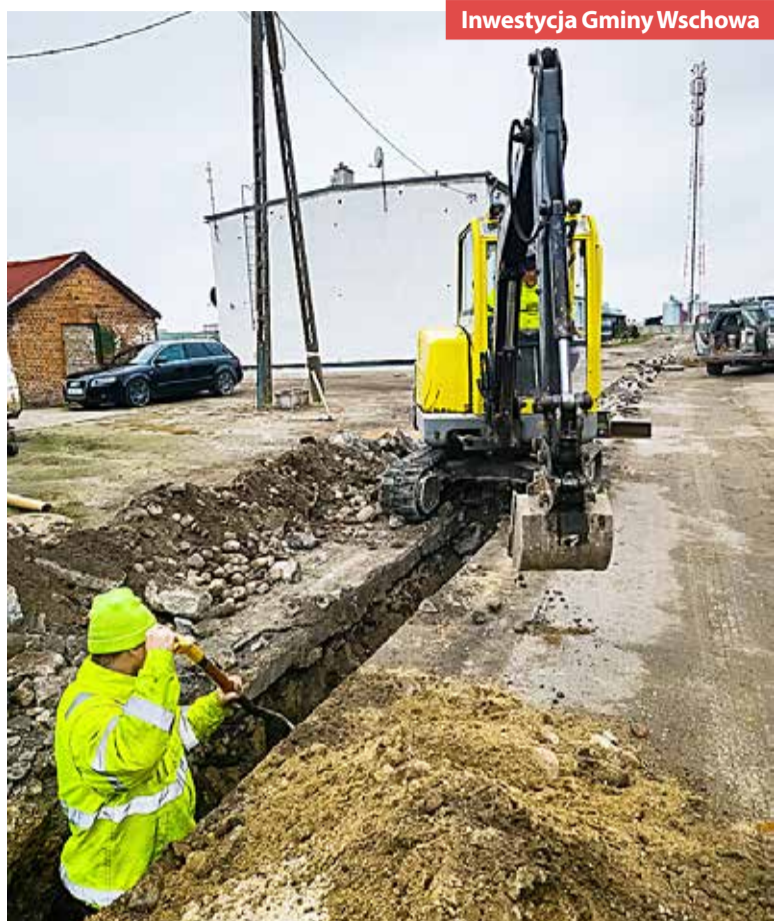
Inwestycja Gminy Wschowa

Wszystko wskazuje na to, że nie do końca roku, a znacznie szybciej zakończą się prace związane z budową nowej sieci kanalizacyjnej w Przyczynie Górnej.