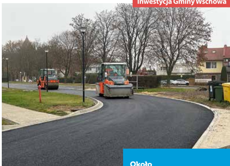
Inwestycja Gminy Wschowa

Wykonawca najpierw przeprowadził frezowanie starych płyt drogowych, uzupełnił nierówności i ułożył dwie warstwy nowej nawierzchni bitumicznej. Wcześniej przeprowadził także regulację studzienek kanalizacyjnych, tak aby znalazły się na równym poziomie z warstwą ścieralną. To jeden z etapów większego projektu modernizacji ciągów komunikacyjnych na os. Jagiellonów. Poza ul. Jagiellońską zmiany obejmą także ul. Zygmunta Starego i Królowej Jadwigi. Będą one dotyczyć nie tylko wymiany nawierzchni dróg, ale też chodników wraz z krawężnikami. Przyczyni się to do poprawy bezpieczeństwa zarówno użytkowników traktów pieszych i rowerowych, jak i poprawy komfortu przemieszczania się samochodami. Dodajmy, że koszt całej inwestycji wyniesie 1,8 mln zł, z czego 1,65 mln