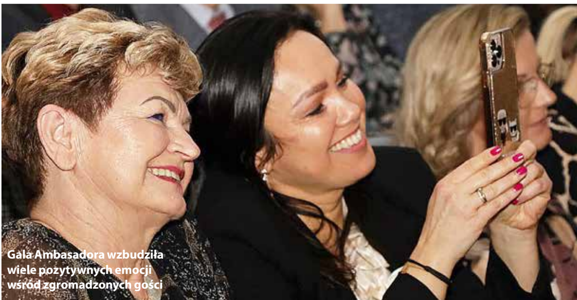
Gala Ambasadora wzbudziła wiele pozytywnych emocji wśród zgromadzonych gości