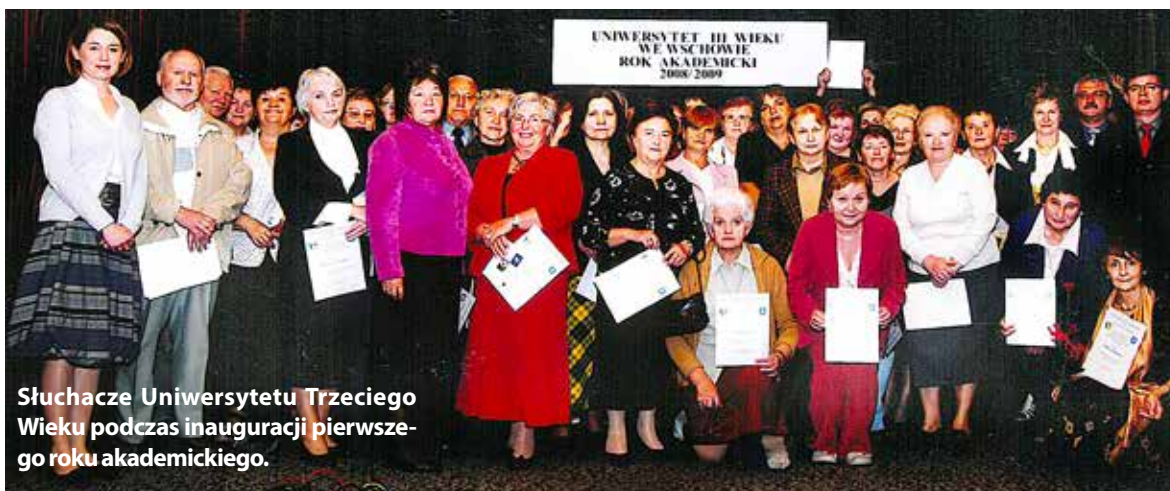
Słuchacze Uniwersytetu Trzeciego Wieku podczas inauguracji pierwszego roku akademickiego.