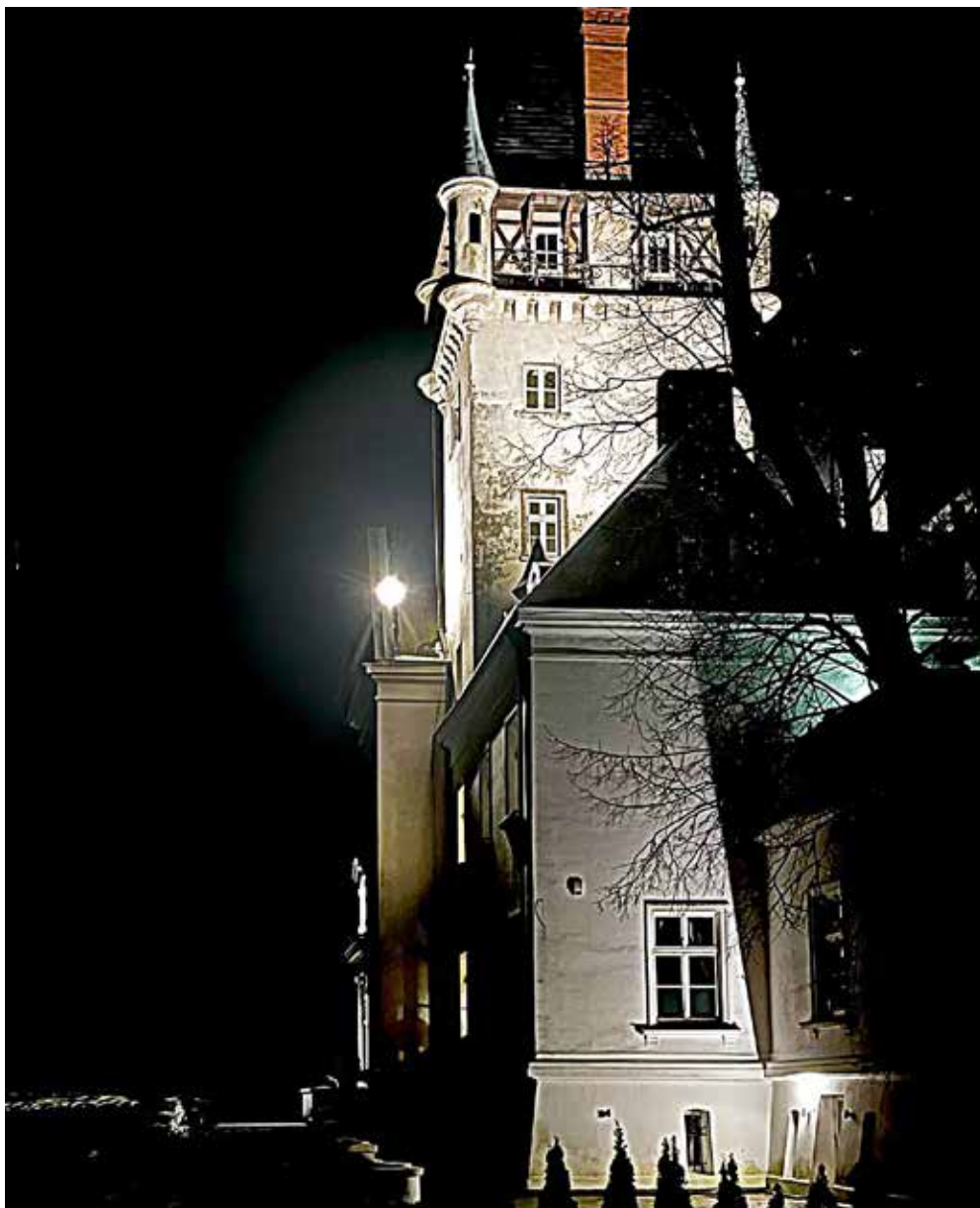
Nocny spacer po Osowej Sieni.